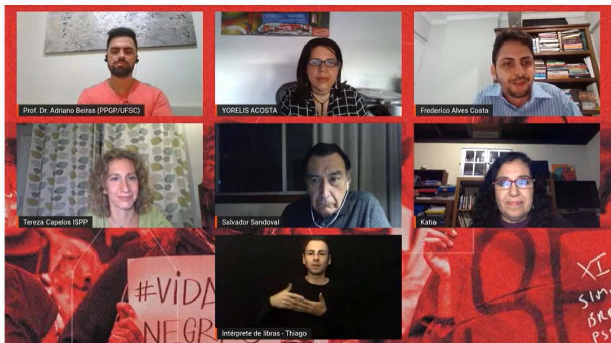
Mesa e Conferência de Abertura do XI Simpósio Brasileiro de Psicologia Política (18/08/2021)